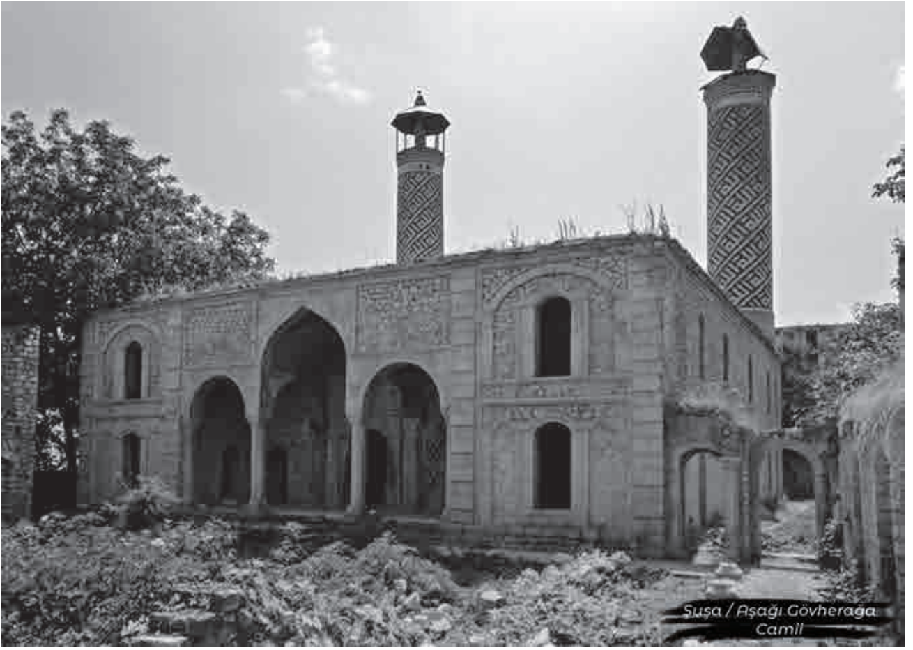
Suşa / Aşağı Gövherağa Cami