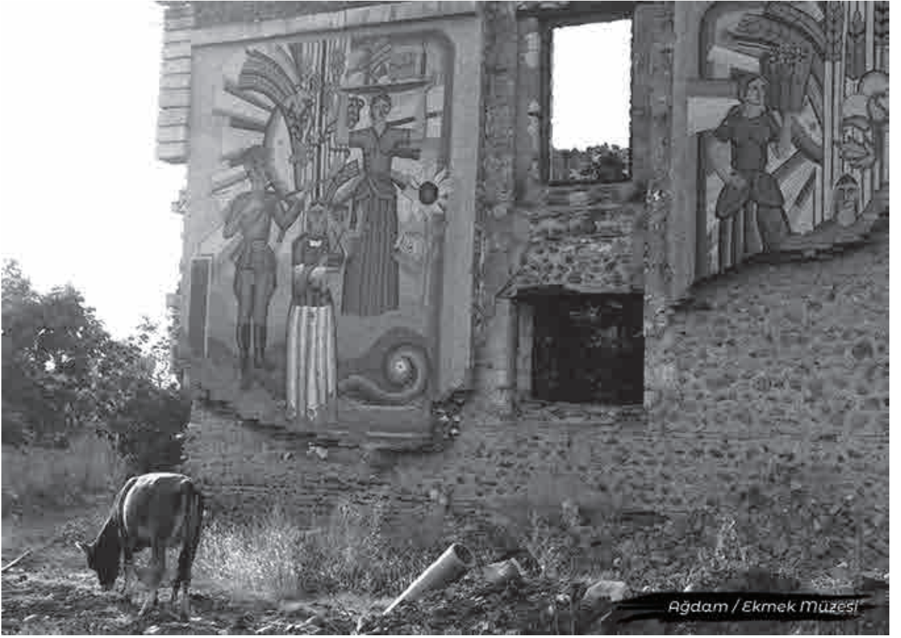
Agdam / Ekmek Müzesi