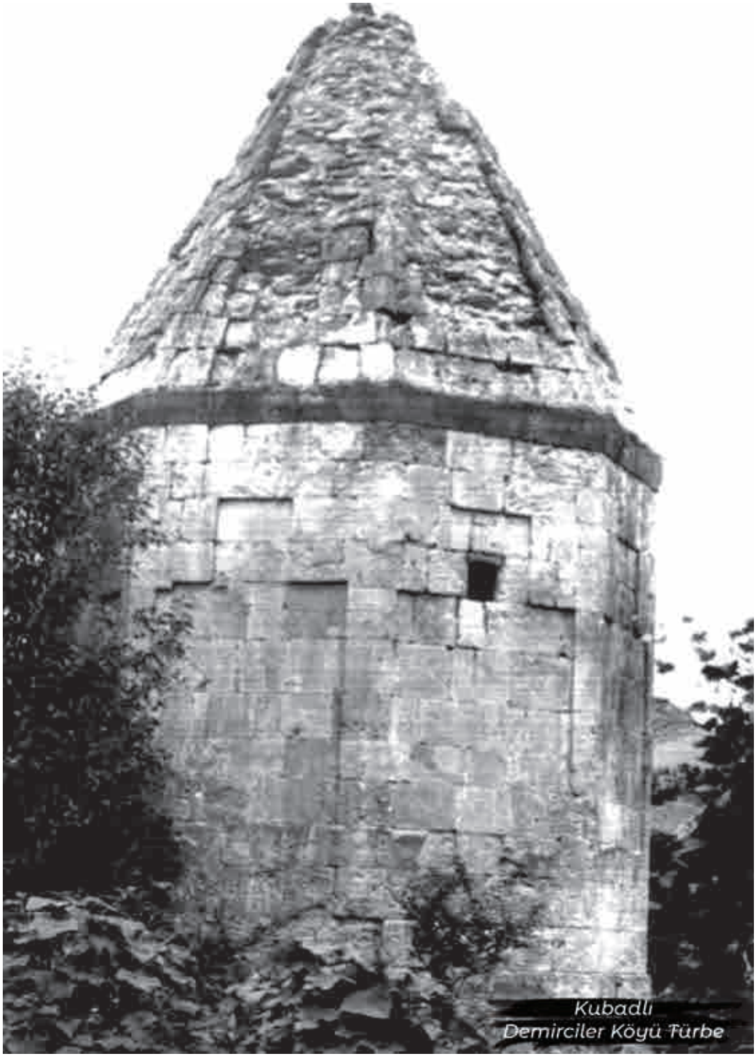
Kubadlı Demirciler Köyü Türbe