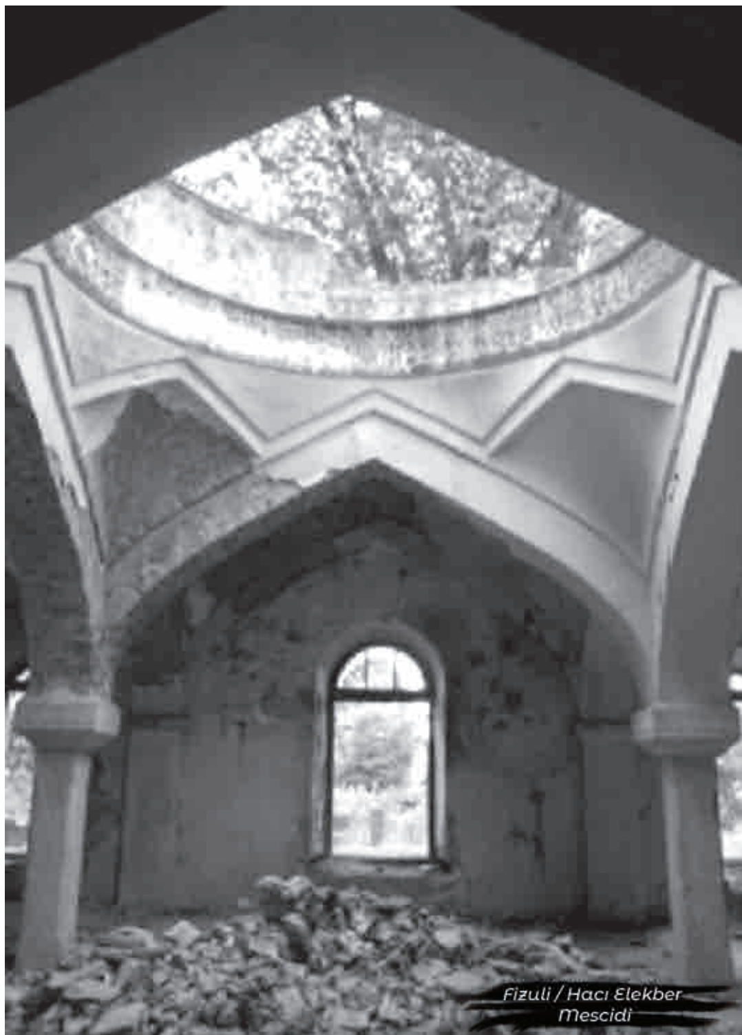
Fizuli / Hacı Elekber Mescidi