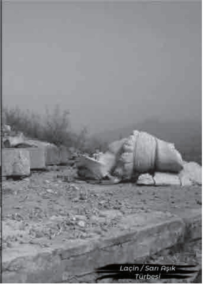
Laçın / Sarı Aşık Türbesi