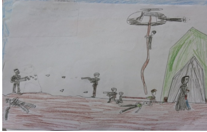
Resim-3:(Adı Valıd, yaşı 10, cinsiyeti kız)

Çocuğun yorumu: Amerika sivil insanları DAİŞ' in elinden kurtarmak bahanesiyle tanklarını göndermiştir. Ama Amerika DAİŞ' i kendisi destekleyerek sivil insanları da öldürmektedir.