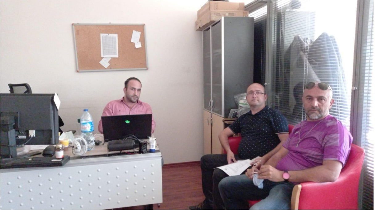
Bölüm Öğretim Elemanlarımızın TELMEK Ziyareti

[A.4.1.3] https://teknikbilimler.gazi.edu.tr/view/page/285947