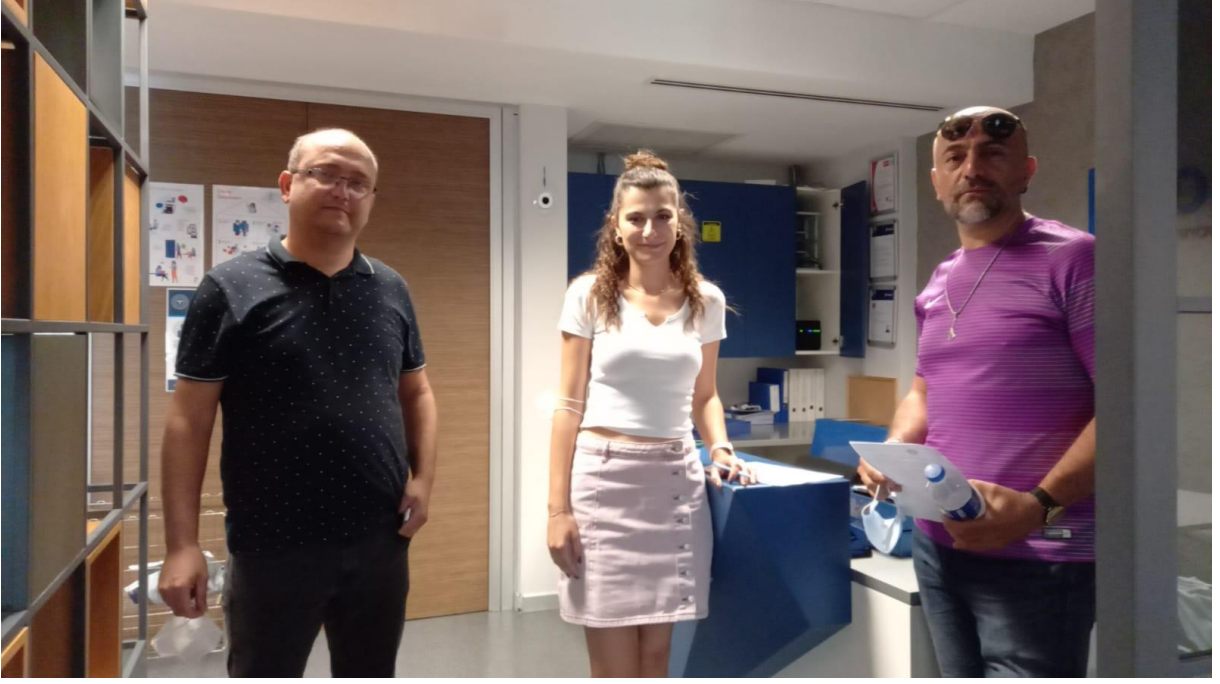
Bölüm Öğretim Elemanlarımızın DEICO Ziyareti