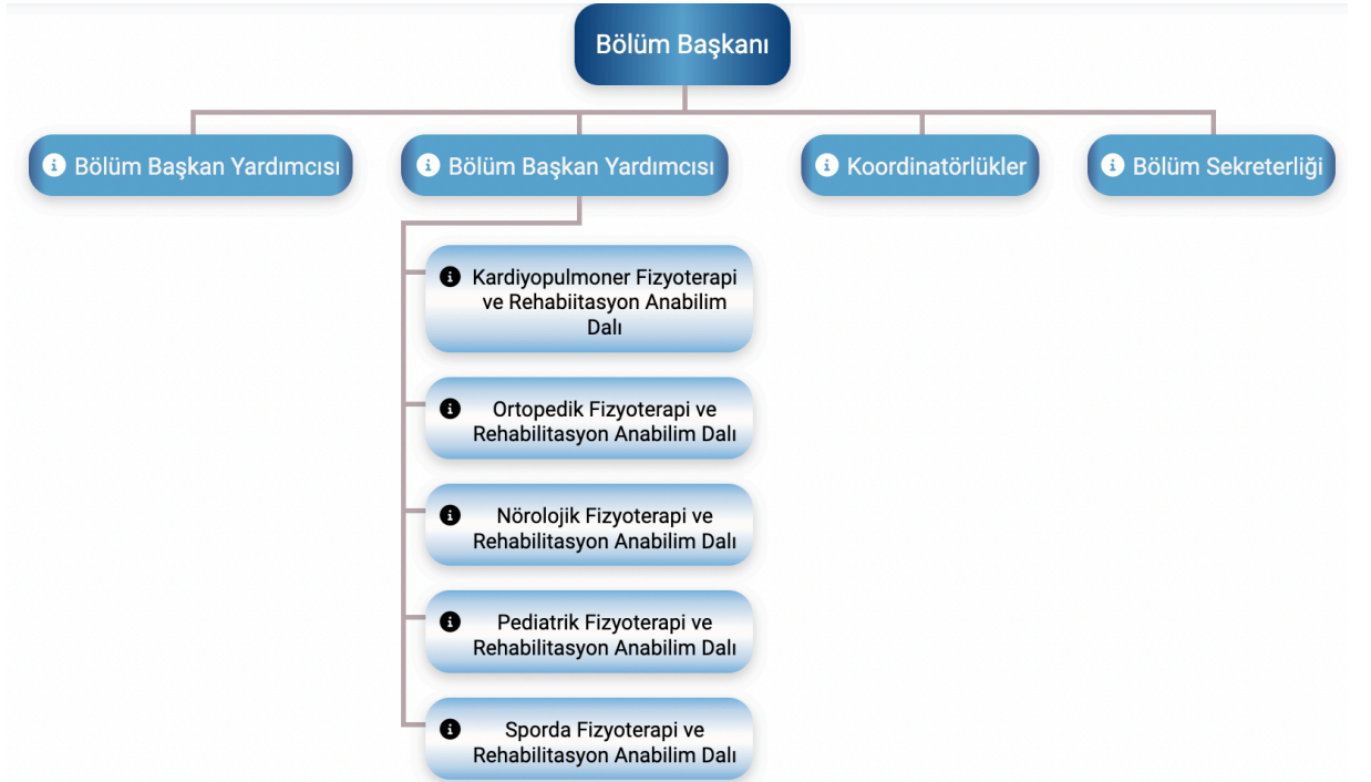
Şekil 2. Gazi Üniversitesi Sağlık Bilimleri Fakültesi Fizyoterapi ve Rehabilitasyon Bölümü Kurumsal Organizasyon Şeması

Bölümümüz kurumsal yapısını koruyarak işleyişin en iyi şekilde yapılmasını sağlayacak uluslararası organizasyon yapısına sahiptir. Bölümümüzün mevcut organizasyon şeması aşağıda verilmiştir (Şekil 1).