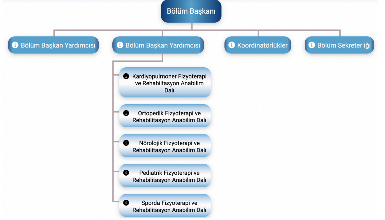
Şekil 2. Gazi Üniversitesi Sağlık Bilimleri Fakültesi Fizyoterapi ve Rehabilitasyon Bölümü Kurumsal Organizasyon Şeması