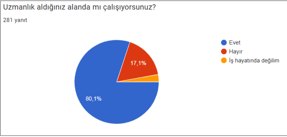
Grafik 31: Mezunların uzmanlık aldığı alanda çalışma durumu