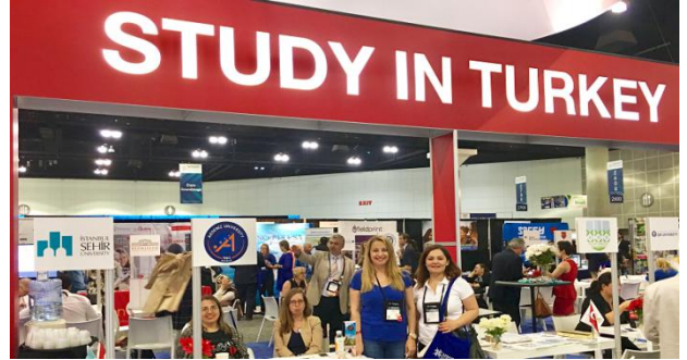
Türk üniversitelerinin bir Turkey. 30.05.2017