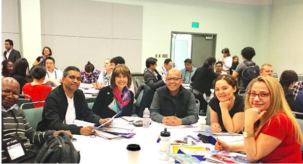
Çalıştay, 29.5.2017 (NAFSA) arada yer aldığı Study in (NAFSA)

Çin'in uluslararası eğitim alanında bir ivme yakaladığı gözlemlenmektedir. Uyguladığı ekonomi politikalarına paralel yürütmekte olduğu yükseköğretimde uluslararasılaşma çalışmaları göz doldurmaktadır.