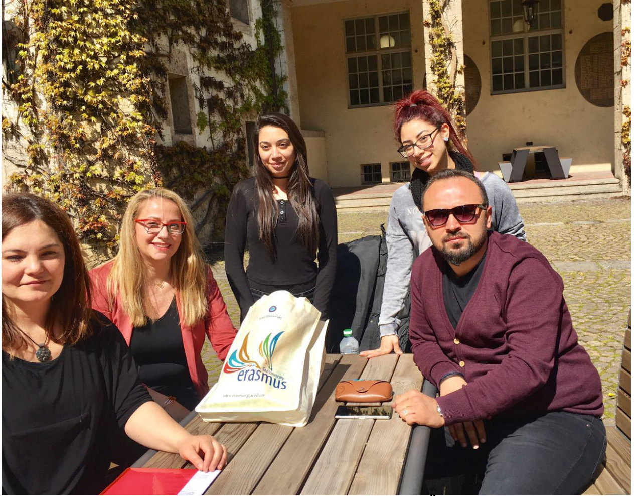
Friedrich-Schiller Universität-Jena'da Giden Erasmus Öğrencilerimizle beraber. (24.04.2017)