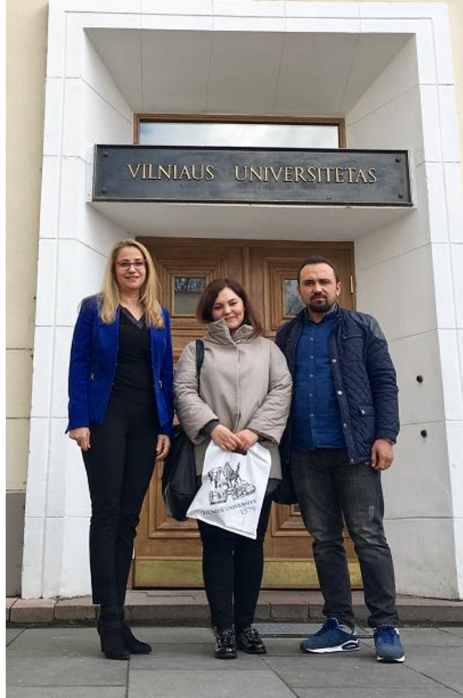
Vilnius Üniversitesi LİTVANYA, 06.04.2017