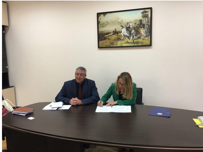
National Aviation Üniversitesi ile Erasmus+ KA- 107 Anlaşması imzalanmıştır