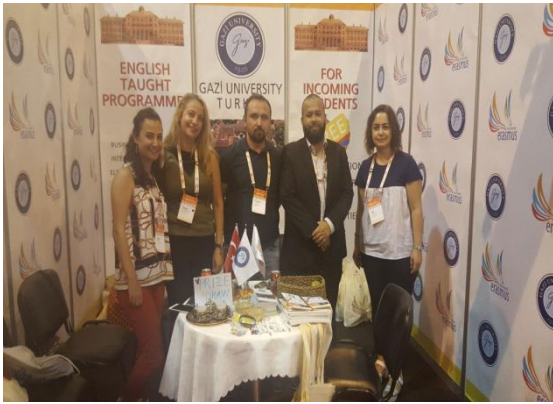
Bangladeş Daffodil International University ile yapılan görüşme