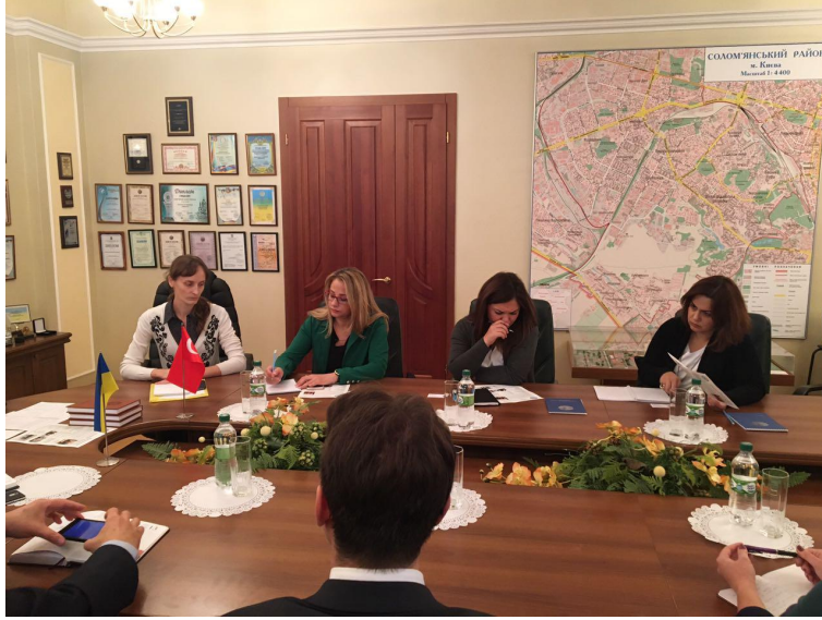
National Aviation Üniversitesi ile Erasmus+ KA107 Anlaşması imzalanmıştır