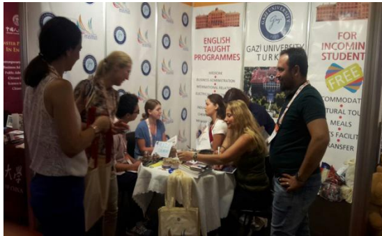
Stockholm University ile yapılan görüşme