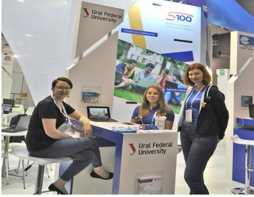
Rusya Ural Federal University ile yapılan görüşme