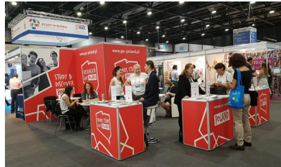
Study in Poland standındaki Polonya üniversiteleriyle yapılan görüşme