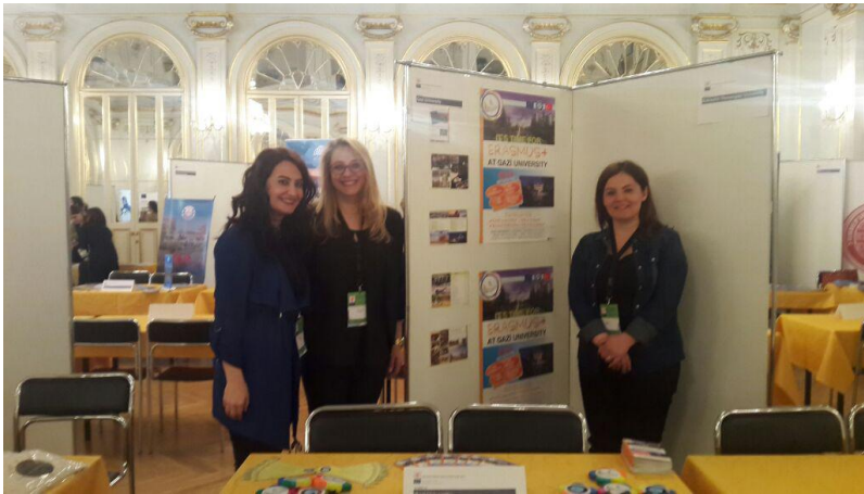
GO EXCHANGE FAIR-(ERACON 2017)