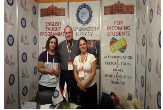
Finlandiya JAMK University of Applied Sciences