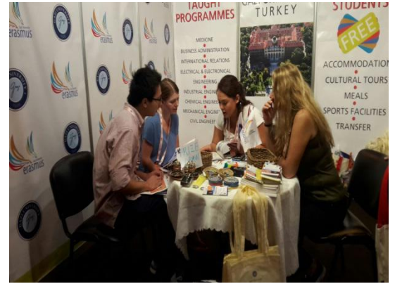
Çin School of Software Engineering Beijing Jiaotong University China