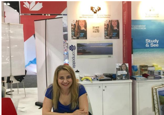
Universidad Del Pais Vasco (İspanya) ile 01.06.2017 görüşme- 01.06.2017 (NAFSA) Abroad” Oturumu)