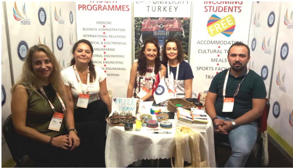
Gazi Üniversitesi EAIE Seville 2017 Standı