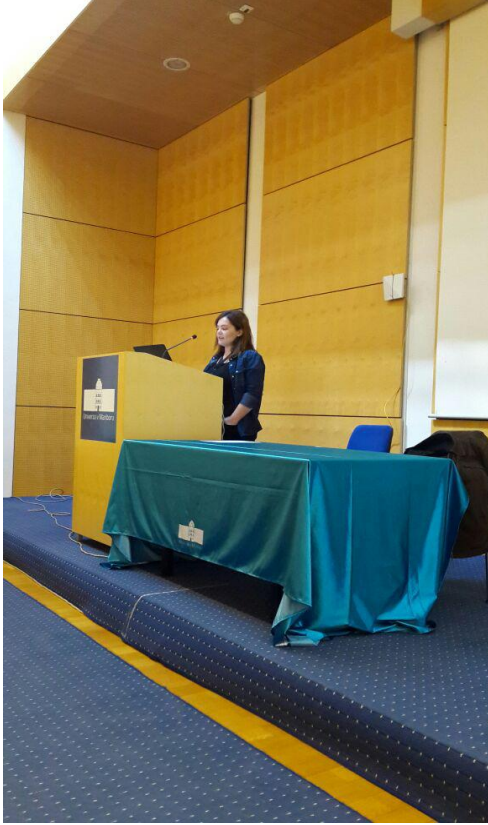
“Raising Student Participation and Awareness about Erasmus+ Mobility Activities and the Efficiency of the Erasmus Office” sözlü sunum ( Eracon 2017-Maribor Üniversitesi Slovenya)