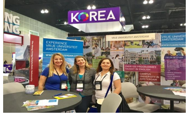
Vrije Universiteit (Hollanda-Amsterdam) ile görüşmemiz 31.05.2017 (NAFSA-2017)