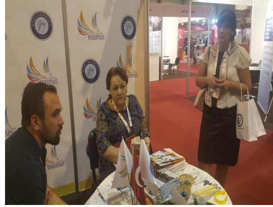
Romanya'nın University of Medicine and Pharmacy of Tirgu Mures Üniversitesi