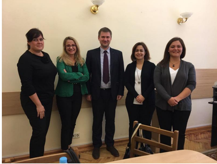
Taras Shevchenko National University Uluslararası İşbirliği Ofisi ile Gerçekleştirilen