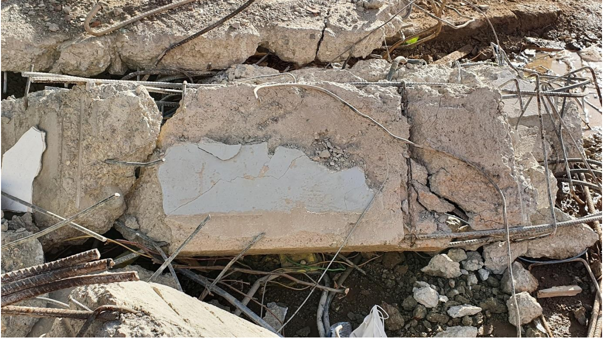
Fotoğraf 4. Bayraklı, Doğanlar Apartmanından çıkarılan betonarme kirişteki asal donatılar, yanıl donatılar ve betonun durumu.

Bölgede farklı türlerde yapısal göçmeler meydana geldiği belirlenmiştir. Tamamen göçen binaların çoğu katların düşey doğrultuda doğrudan birbirlerinin üzerine oturması şeklinde meydana gelmiştir. Çok açık bir şekilde bu tür göçmelerde en önemli sebepler beton dayanımının yetersizliği, donatı yetersizliği ve uygunsuzluğudur. Detaylı yapılacak çalışmalar sonucunda ortaya konulması gerekirken birlikte zayıf kolon-kuvvetli kiriş, yumuşak kat uygulaması da diğer sebepler arasında görünmektedir. Hatta bu sebeplerden dolayı bazı binalarda sadece zemin kat bölgesi ile sınırlı kalan kısmi göçmeler meydana gelmiştir.