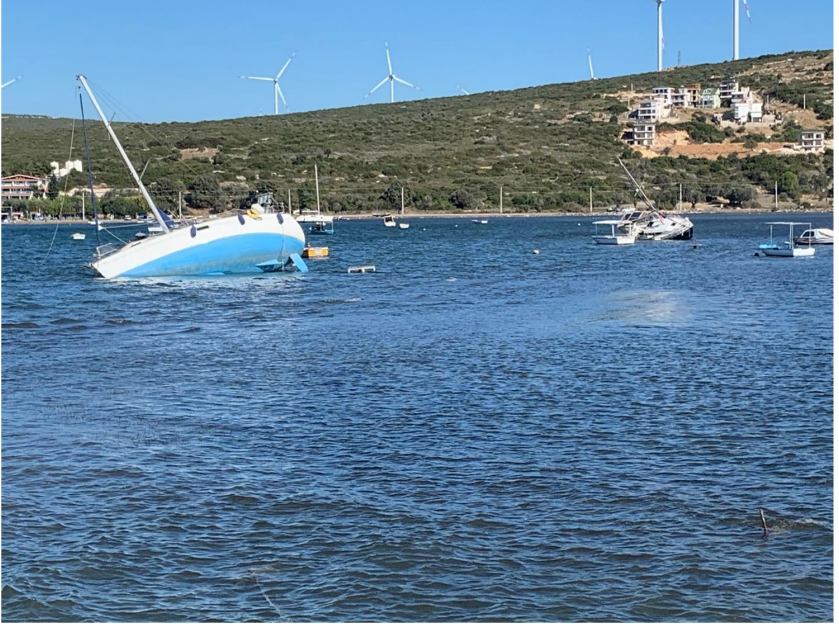
Fotoğraf 1. Sığacık körfezinde deprem sonrası oluşan Seyşe (tsunami) etkisi ile oluşan yat kazaları.

yükselmiştir. Deprem ya da fırtına etkenli Seş dalgaları kapalı veya yarı kapalı körfez gibi basenlerde etkisini gösteren ve yansımaya uğrayarak yüksekliğini artıran uzun periyotlu dalgalardır. Bu tür uzun dalgalar, körfez gibi yarı kapalı su basenlerinde periyotlarının körfezin doğal salınım periyodu ile çakışması durumunda rezonansa uğrayarak, yıkıcı sonuçlara sebebiyet verebilmektedir. Bu nedenle deprem kaynaklı deniz dalgaları ve bunların yansımaları, Ege Denizi'nde bulunan körfezler için önemli bir risk teşkil etmektedir. Özellikle nehirlerin kuvvetli debileri ile fırtına ya da deprem kaynaklı deniz suyu seviye yükselmeleri çakıştığında, kıyı alanlarında önemli boyutlarda taşkın bölgeleri oluşmaktadır.