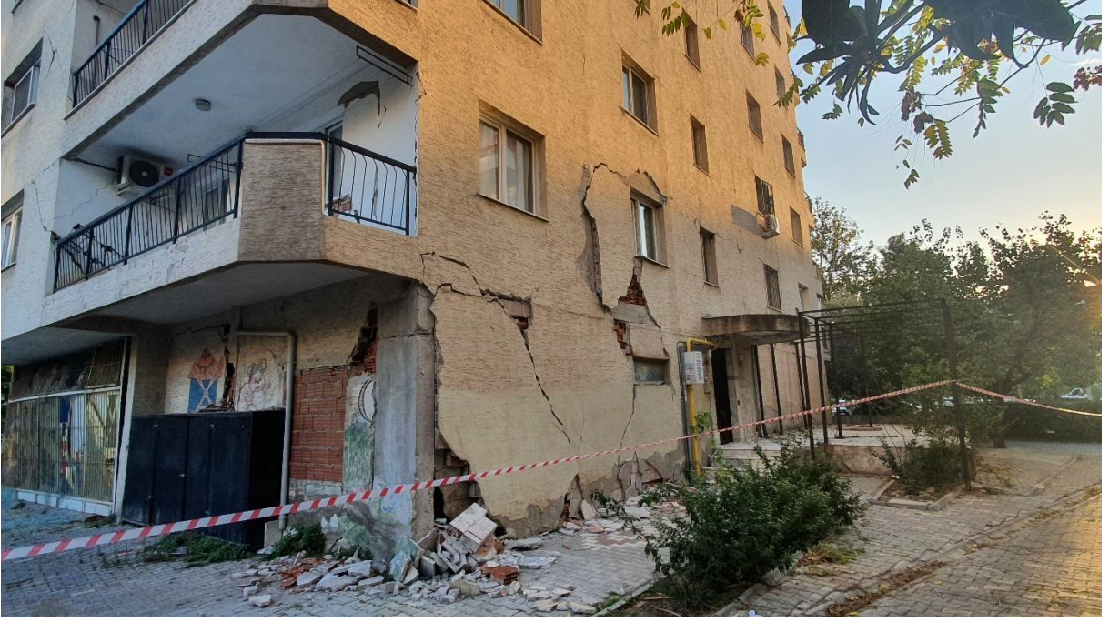
Fotoğraf 5. Bayraklı ilçesinde bodrumsuz 8 katlı bir betonarme binada zemin ve 1. kat hasarı.