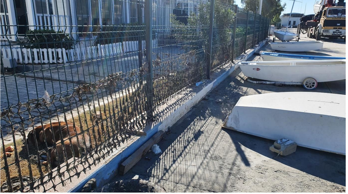
Fotoğraf 2. Sığacık körfezinde deprem sonrası oluşan Seyşe (tsunami) etkisi ile yükselen su seviyesi izi. Yaklaşık 2 m.