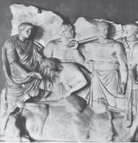
Şekil 6: Haruspex (Çömelmiş Vaziyetteki Kişi) (Rölyef) (Massa, 1973: 128)