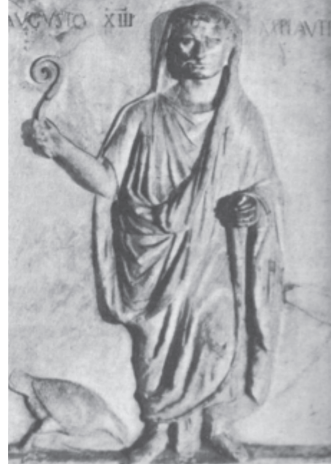
Şekil 7: Augur (Rölyef) (Massa, 1973: 132)