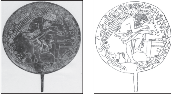
Şekil: 4a & Şekil: 4b

Netsvis (MÖ IV. yy., Bronz El Aynasında Figür) & (Aynanın Çizimi) (Von Vacano, 1960: II) & (Bloch, 1960: 147)