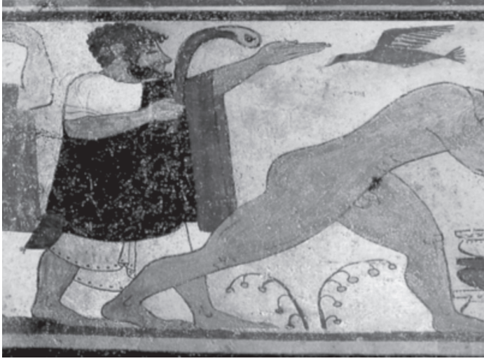
Şekil 5: Kuş Uçuşu Falı Bakıcısı Etrüsk Din Adamı (MÖ VI. yy., Tarquinii'deki Augur'lar Mezarı'nda Fresk) (Gore, 1988: 722)