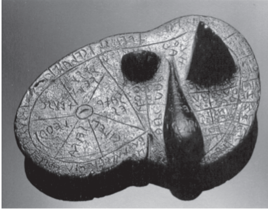
Şekil 3: Etrüsk Karaciğer Modeli (MÖ III/II. yy., Bronz) (Gore, 1988: 735)

Tanrı Şarruma'nın Koltuğu ve Koruması Altında IV. Tuthaliya (MÖ 1220, Yazılıkaya B Galerisi'nde Rölyef) & (Rölyefin Çizimi) (Alp, 2005: 20)