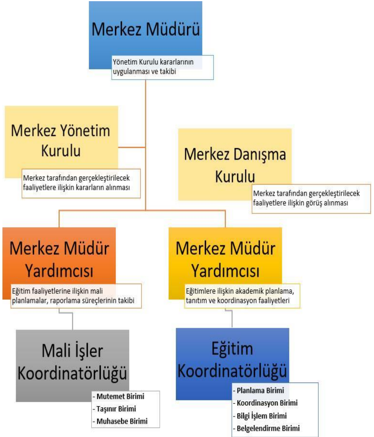
Şekil 6: Merkeze Ait Yönetim Şeması