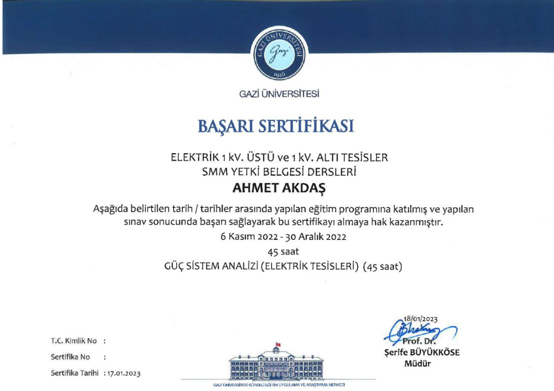
Şekil 4: Katılım Sertifikası Örneği