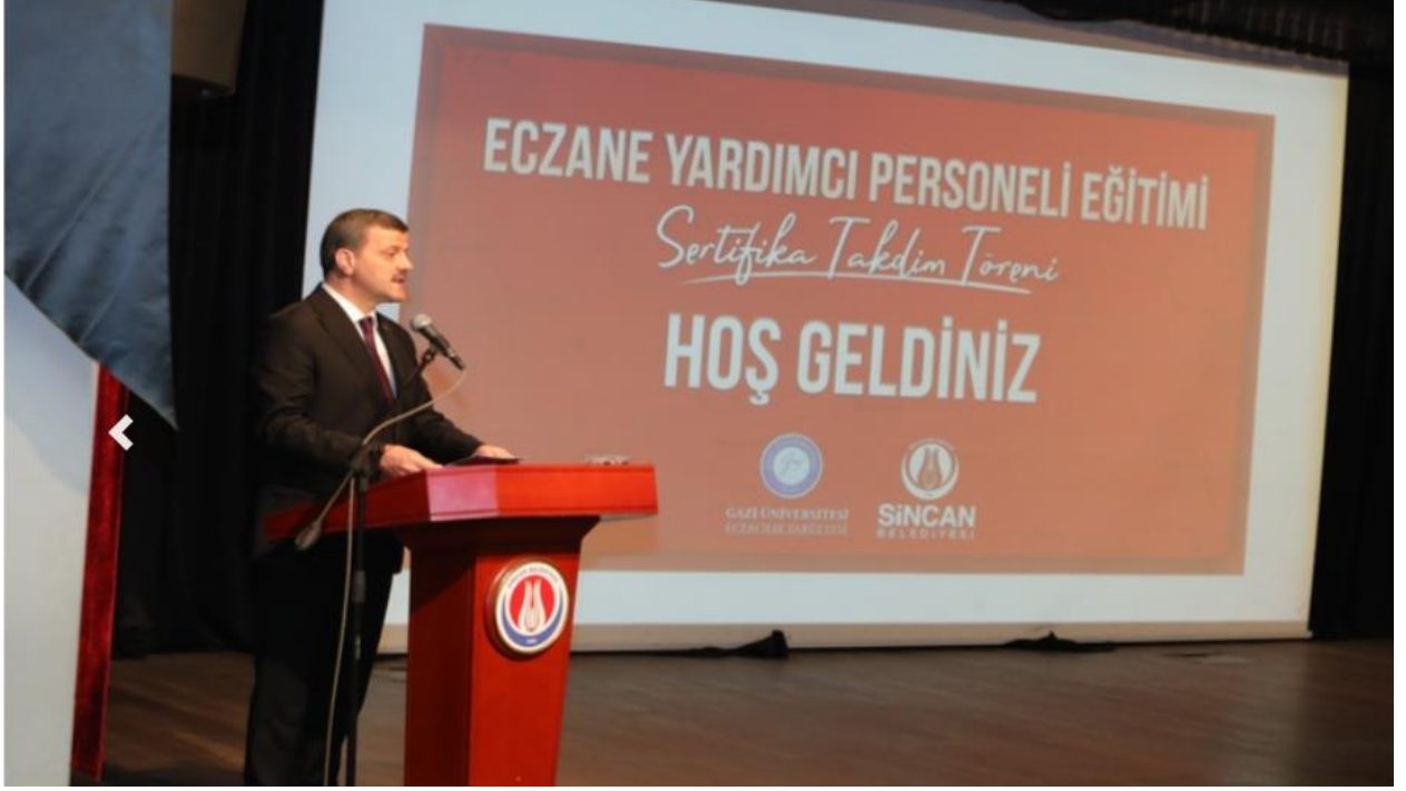
Şekil 13. Eğitim/Sertifika Tören Fotoğrafları